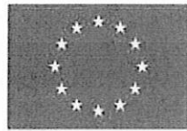
Unione europea Fondo sociale europeo